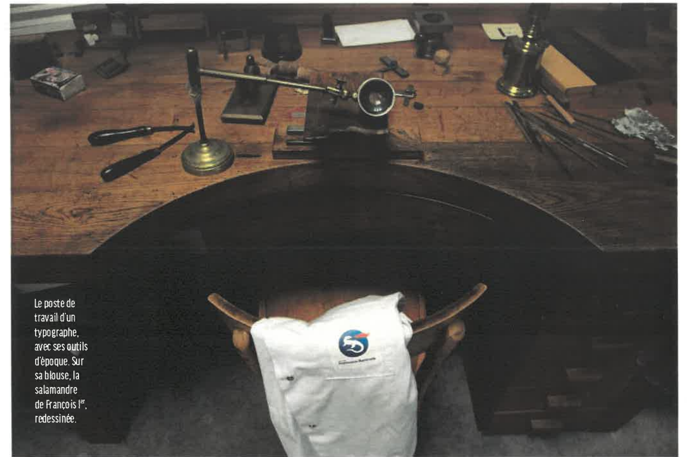
Le poste de travail d'un typographe, avec ses outils d'époque. Sur sa blouse, la salamandre de François I er , redessinée.